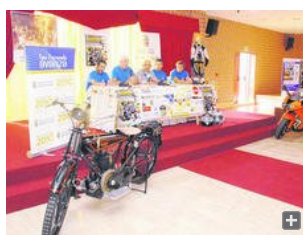
Momento de la presentación del evento, a principios de mes.

Hace ya más de un año, el 14 de junio de 2008, desde que un grupo de apasionados de las motos decidieron formar el primer club de motociclismo de La Isla. Aquellos pioneros eran 70, la mitad policías locales y el resto trabajadores de Navantia. Hoy suman casi 200 miembros, provenientes de toda la Bahía. Todos ellos preparan para el sábado su II concentración motera.